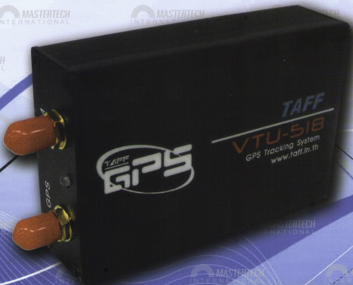
TAFF GPS Vehicle Tracking Unit รุ่น GP-VTU-518